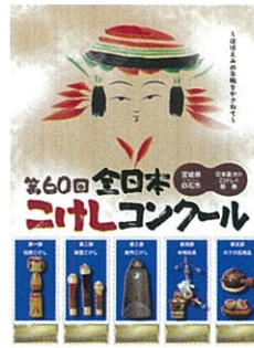
▲オリジナルフレーム切手