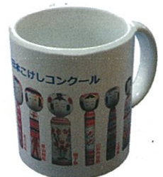
▲伝統こけし10系統マグカップ